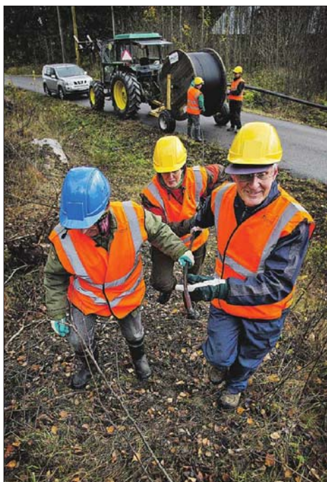
Sex kilometer kabel skall ännu höst läggas ner invid Kroksnäs-vägen och fram till Hummelsund.