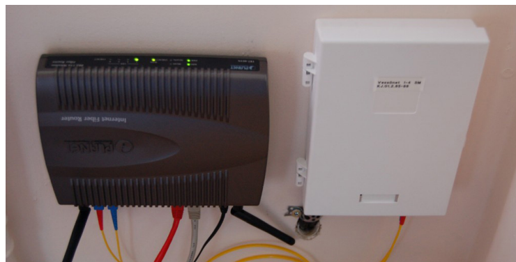
Stor-Kroksnäs konferensgårds huskoppling augusti 2012.